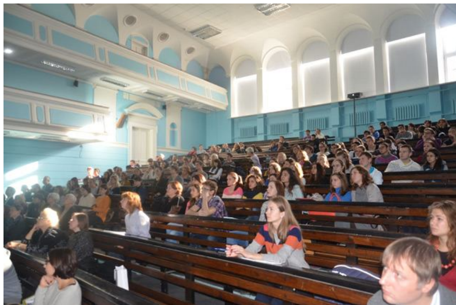
Показ фильма "Привитые: любовь, страх и вакцины".