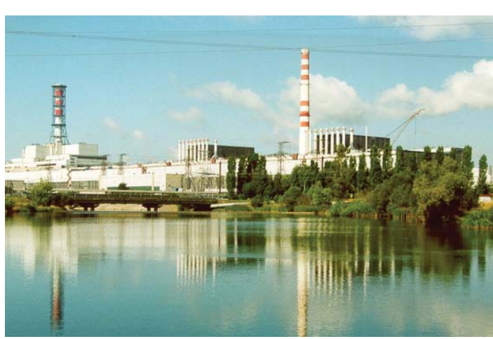
Город Курск. Курская АЭС.

Сегодня в нашей организации работают около 130 человек, ведь сейчас нет таких