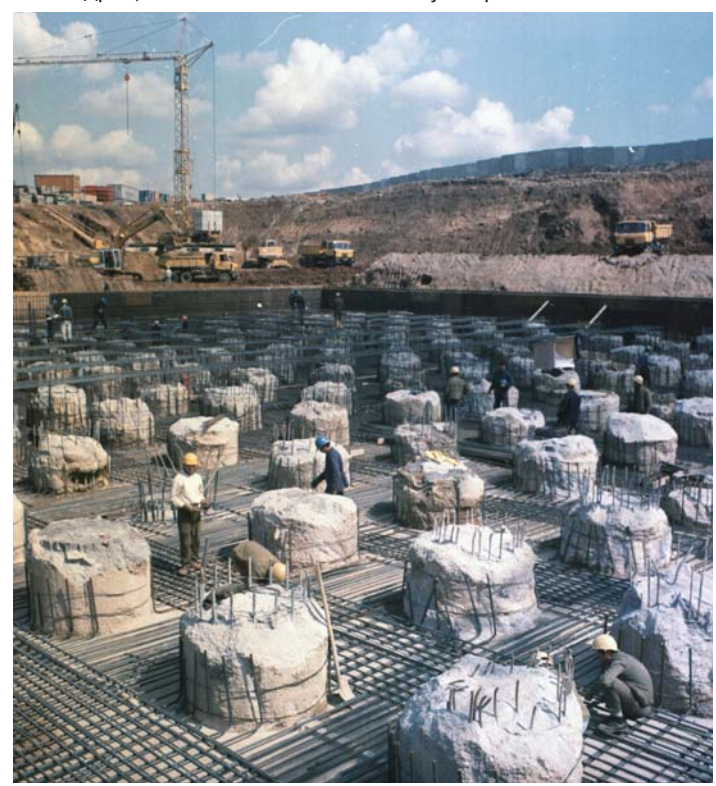
Свайное основание из свай буронабивных свай.