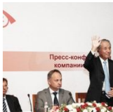
Ясучика Хасегава, президент и главный исполнительный директор (СЕО) компании "Takeda": "Россия — крупнейший для нас быстроразвивающийся рынок по объему продаж, и мы ожидаем, что он будет вносить существенный вклад в общий рост Takeda в течение ближайших лет".

Опубликовал в 01.10.2012. Опубликовано в Бизнес и инвестиции , Главное