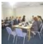
В Москве прошел образовательный круглый стол «Биопрепараты и биоаналоги: перспективы развития фармацевтического рынка в России». В мероприятии ...